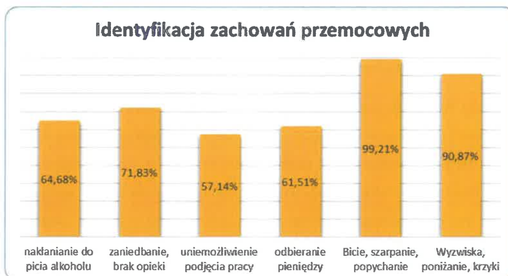
Wykres nr 2 identyfikacja zachowań przemocowych

Diagnoza Lokalnych Zagrożeń Społecznych Gmina Myślenice przeprowadzona w 2021r. w okresie wskazuje, że mieszkańcy Gminy identyfikują różne formy przemocy w rodzinie. Wykres 1 przedstawia procentowy wskaźnik odpowiedzi badanych respondentów. 3