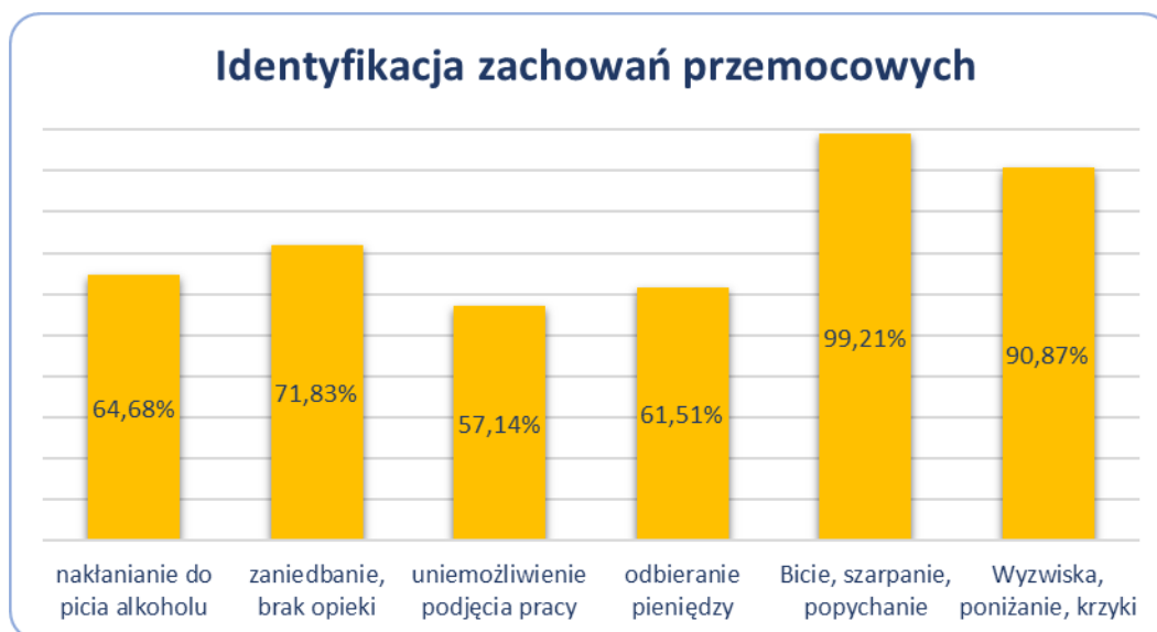
Wykres nr 2 identyfikacja zachowań przemocowych

Diagnoza Lokalnych Zagrożeń Społecznych Gmina Myślenice przeprowadzona w 2021r. w okresie wskazuje, że mieszkańcy Gminy identyfikują różne formy przemocy w rodzinie. Wykres 1 przedstawia procentowy wskaźnik odpowiedzi badanych respondentów. 3