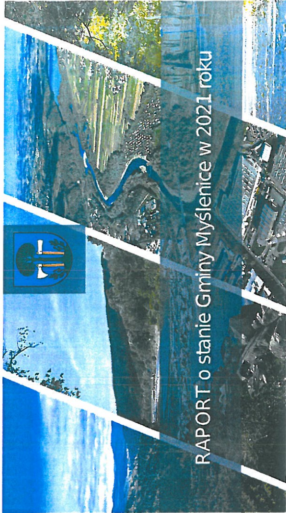
RAPORT o stanie Gminy Myślenice w 2021 roku